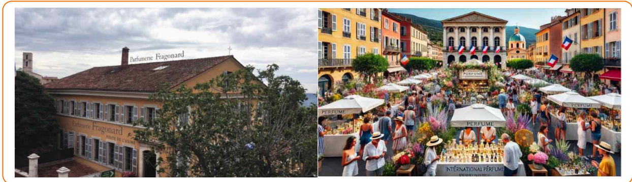
<자료> 고양시정연구원(2023). 고양특례시 일산동구청 광장 특화 방안; ChatGPT 4o