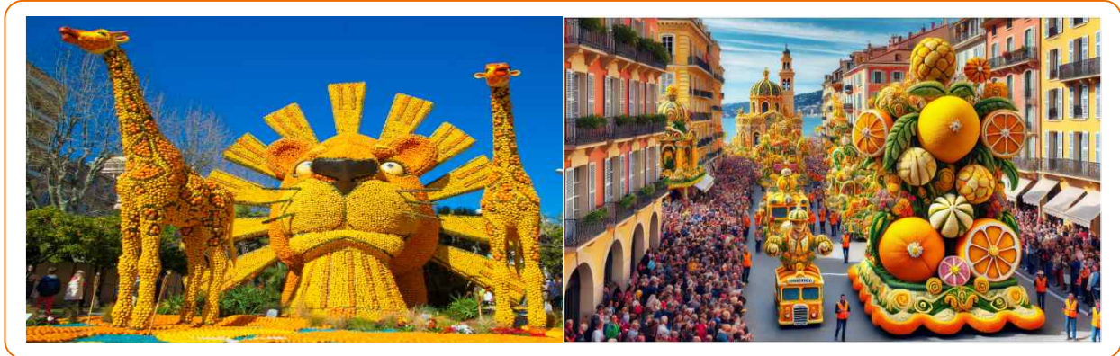
<자료> 고양시정연구원(2023). 고양특례시 일산동구청 광장 특화 방안; https://www.fete-du-citron.com/-programme-.html ; ChatGPT 4o